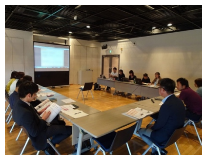
ワーキングチームの会議