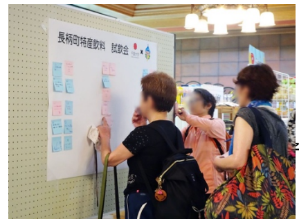
リソル生命の森で開催した試飲会の様子