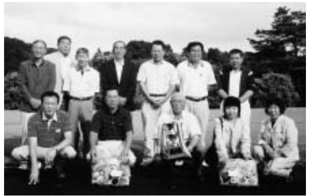
優 勝 ゴルフ団体の部