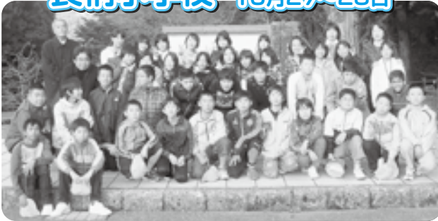
神奈川県立恩賜箱根公園