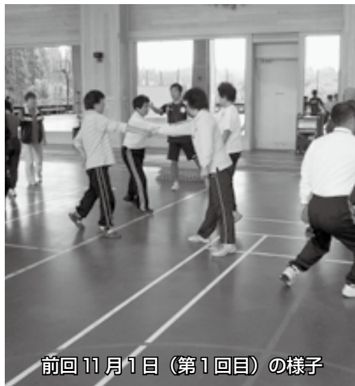
前回11月1日(第1回目)の様子

問い合わせ先 住民課 保険住民班 ☎35-2113 健康福祉班 ☎35-2414