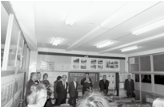
日吉小学校の教室を視察する委員