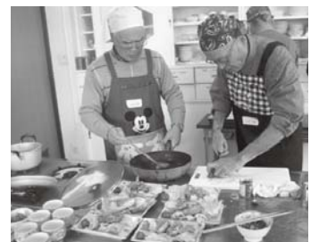
▲昨年の男性の料理教室