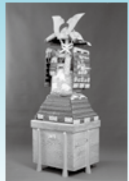
赤糸威大鎧複製 (原品:榊引八幡宮蔵)