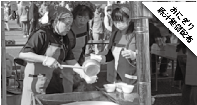
おにぎり 豚汁無償配布