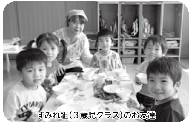
すみれ組(3歳児クラス)のお友達