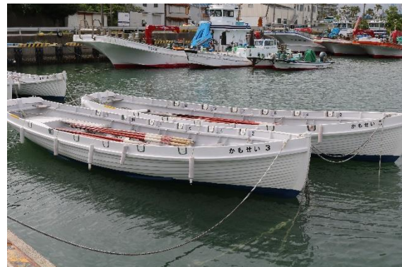
港からカッターで出発