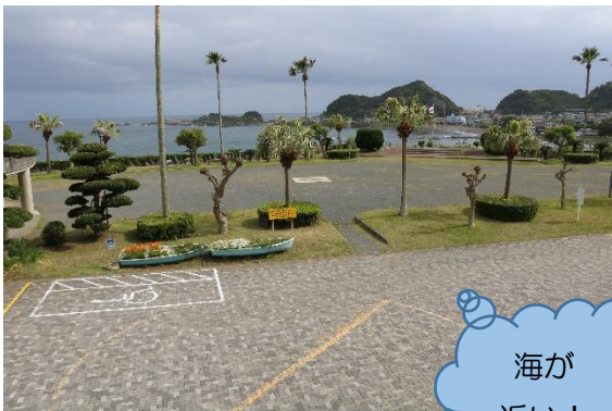
玄関前つどいの広場