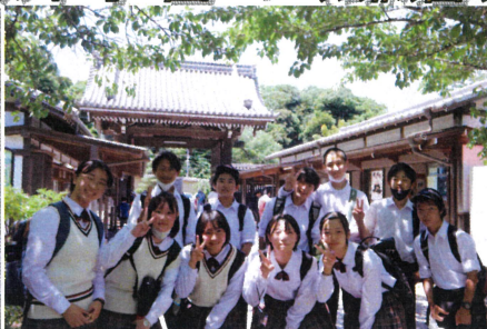
【 建長寺 】