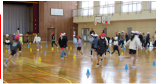
全校「遊・友スポーツチャレンジちば」