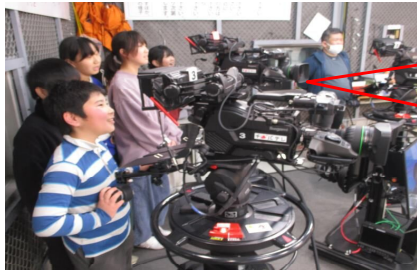
5年生「千葉テレビ」社会科見学