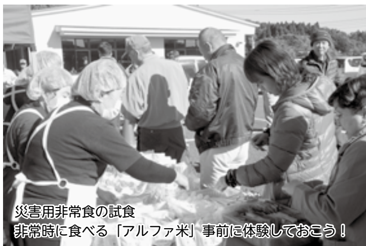
災害用非常食の試食 非常時に食べる「アルファ米」事前に体験しておこう！