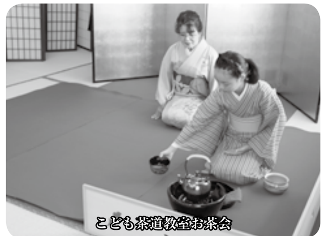
こども茶道教室お茶会