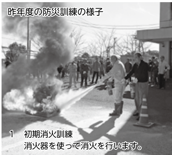
昨年度の防災訓練の様子