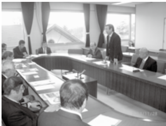
草津町の議員と意見交換

今後もより良い長柄町議会の運営はもとより、町民の皆様のためにも研鑽を積んでまいりたいと考えております。