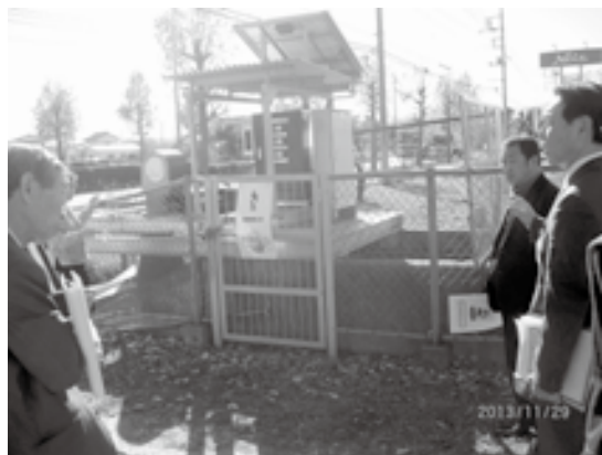
マイクロ水力発電施設研修