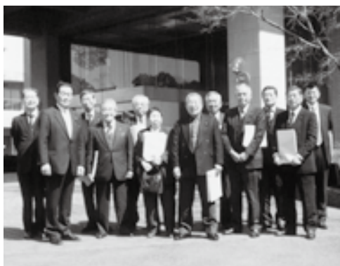
議会報編集委員会（右向き）

今回の訪問に対し、議長さん副議長さん議会運営委員長さん議会報編集委員長さんはじめ十三名の議員さん、事務局の皆様には和氣藹々のうちにお話しが出来たこと貴重な体験をした事を喜んでおります。ありがとうございました。紙上お借りしてお礼申し上げます。