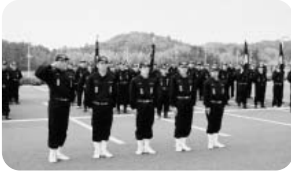
最優秀賞に輝いた第2分団第2部