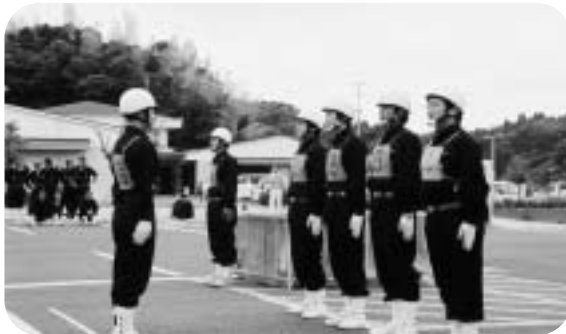
優秀賞の第2分団第1部