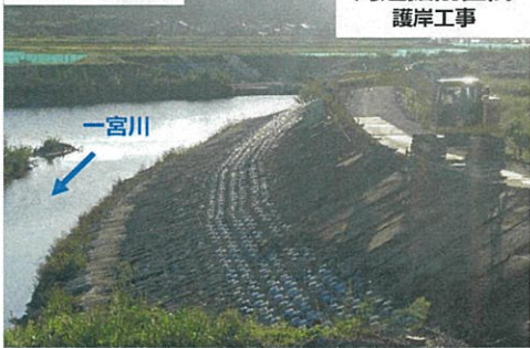
河道掘削区間 護岸工事