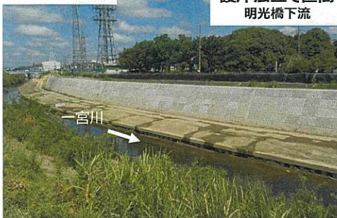
護岸法立て区間 明光橋下流