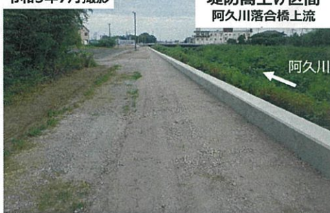
堤防嵩上げ区間 阿久川落合橋上流