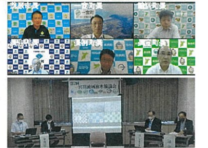
第7回一宮川流域治水協議会の様子

県関係部署及び流域市町村長からなる 第7回一宮川流域治水協議会 を開催しました。 日時：令和5年8月29日（火） 場所：WEB開催 出席：千葉県県土整備部、農林水産部 茂原市長、一宮町長、睦沢町長、長生村長、長柄町長、長南町長