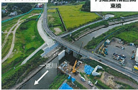
河道拡幅区間 東橋