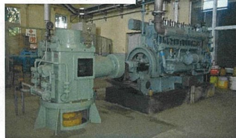
川中島終末処理場雨水ポンプ (茂原市)