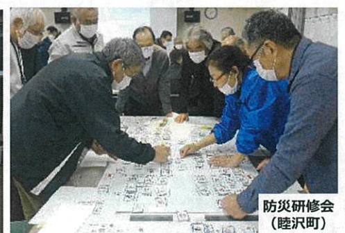
防災研修会 (睦沢町)