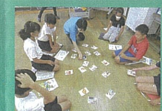
[4年] 認知症サポーター講座