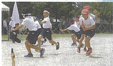
緊張のバトンパス！成功！！