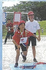
[5・6年] ランドセルを背負って「無事に家に帰ろう！」いくぞ！おーっ！！綱引きも気合十分