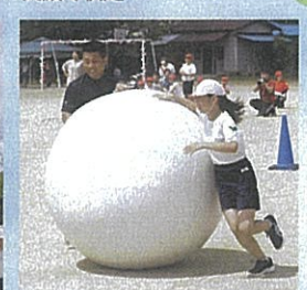
[6年親子競技] 運べ！私たちの思い！！小学校生活最後の親子競技で成長を実感。