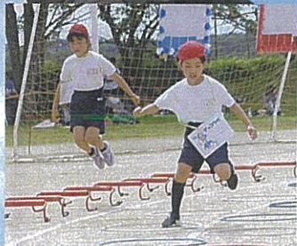
[3・4年] 障害物もピョン、ピョン！