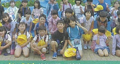
[1・2年] 校外学習 鴨川シーワールド