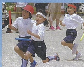
白熱！天下分け目の紅白リレー！