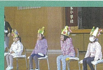
[全校] 入学を祝う会