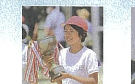
紅白リレー優勝、紅帽子チーム