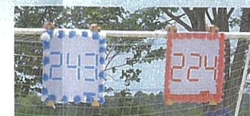
優勝 白組、応援賞 紅組