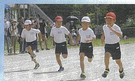
[1・2年] マリオになって日ダッシュ！