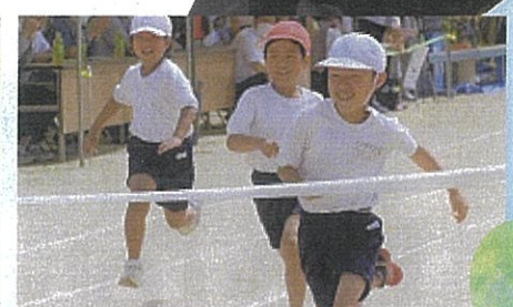
とびきりの笑顔で快走！