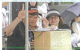
お茶目な先生たち