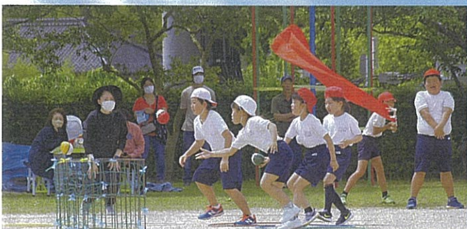
[3・4年] ポケモンマスターへの道～「ピカ！」ときどき「めえ」～