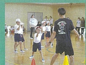
[全校] 親子ドッジボール大会