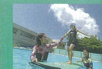
[全校] 長生郡市小学生サーフィン体験