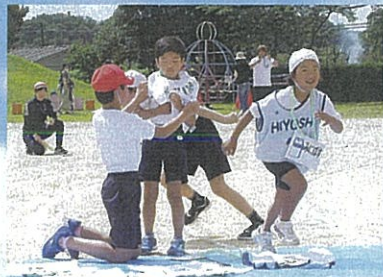
[1・2年] 早着替えて「日吉ショウタイム」どんな服に変身するかな。