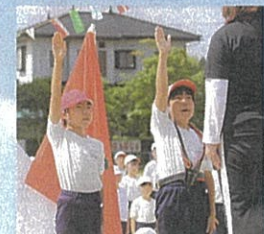
ハツラツと選手宣誓