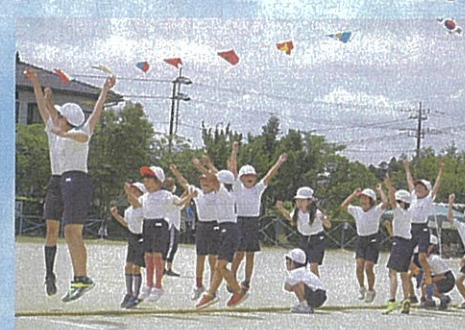
やったー！！喜びを全身で表す姿がまぶしい。