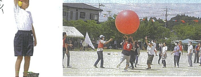
[PTA] スーパー大玉運び