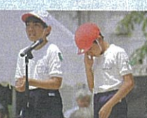
最後は、感動の団長あいさつ