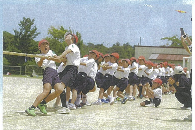
4年ぶりに行われた「帰ってきた綱取り物語」心をついによいしょ！よいしょ！見ているこちらも力が入ります。