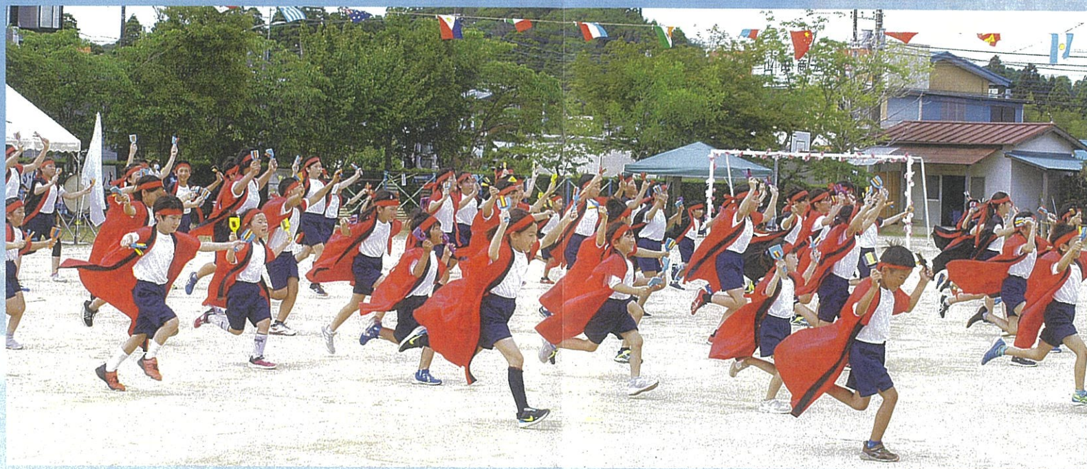
日吉小の伝統、全校児童による勇壮な「YOSAKOIソーラン」4・5・6年生になると振付が難しくなる見ごたえのある演舞。たくさん練習したね。