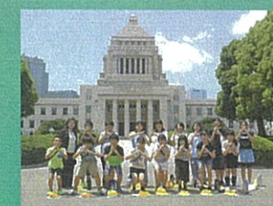
[6年] 校外学習 国会議事