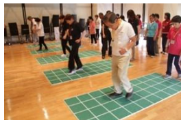
高齢者外出支援・介護予防教室