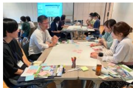
千葉大生と地域住民が学び合う生涯学習講座