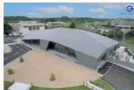
R5年5月長柄町新公民館「ながランホール」開館