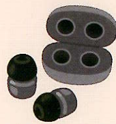
ワイヤレスイヤホン