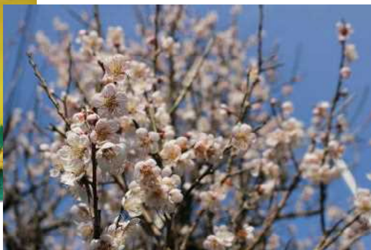
令和4年3月4日(金) 校内ロータリーの梅花