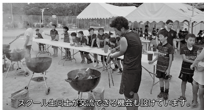
スクール生同士が交流できる機会も設けています。