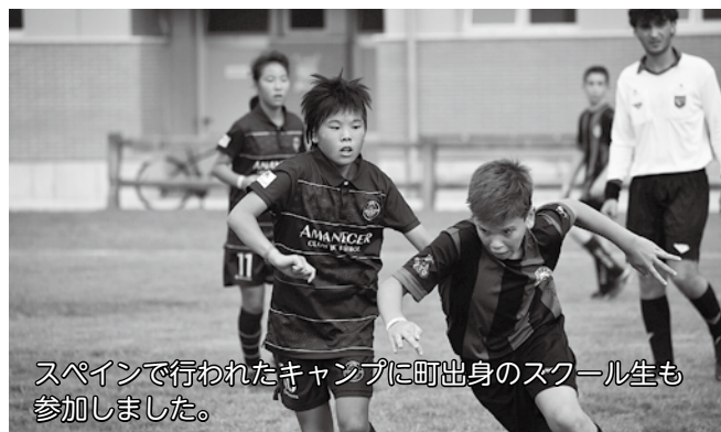
スペインで行われたキャンプに町出身のスクール生も参加しました。

スクールでは無料練習体験も随時募集しております。スペイン語や英語を交えたトレーニングを是非一度体験してみませんか？右記よりお気軽にお問い合わせください。