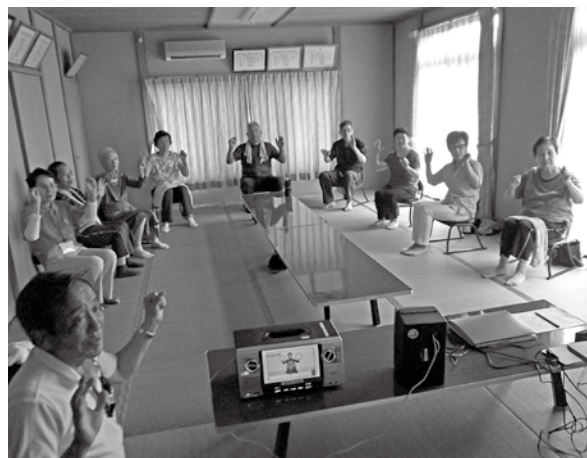
グーチョキパー体操の様子