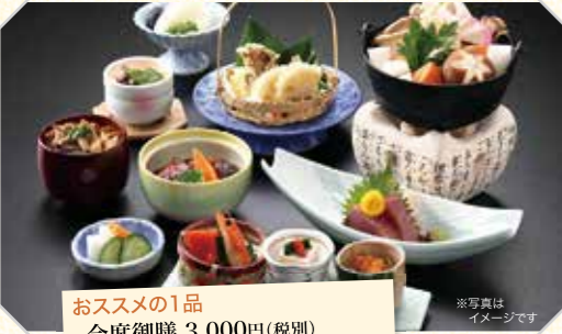
おすすめの1品 会席御膳 3,000円(税別)