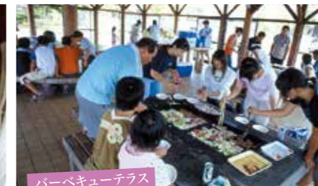
バーベキューテラス