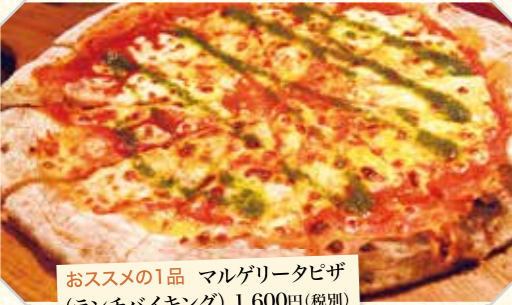
おすすめの1品 マルゲリータピザ(ランチバイキング) 1,600円(税別)