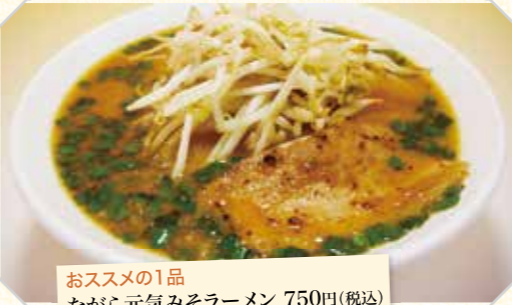
おすすめの1品 ながら元気みそラーメン 750円(税込)