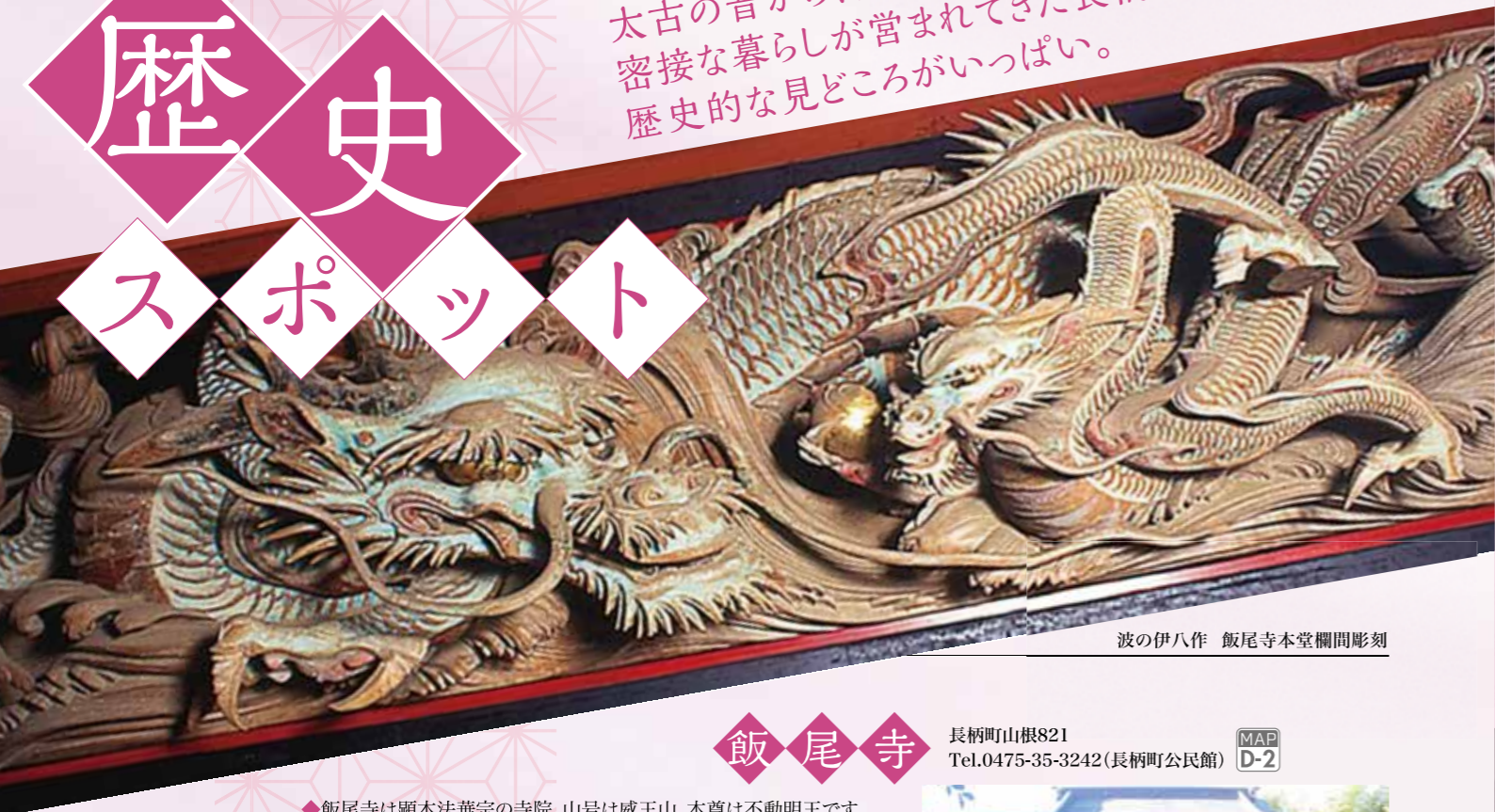
波の伊八作 飯尾寺本堂欄間彫刻

太古の昔から、自然や神仏と密接な暮らしが営まれてきた長柄町には、歴史的な見どころがいっぱい。