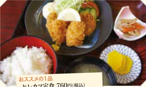
おすすめの1品 ヒレカツ定食 760円(税込)