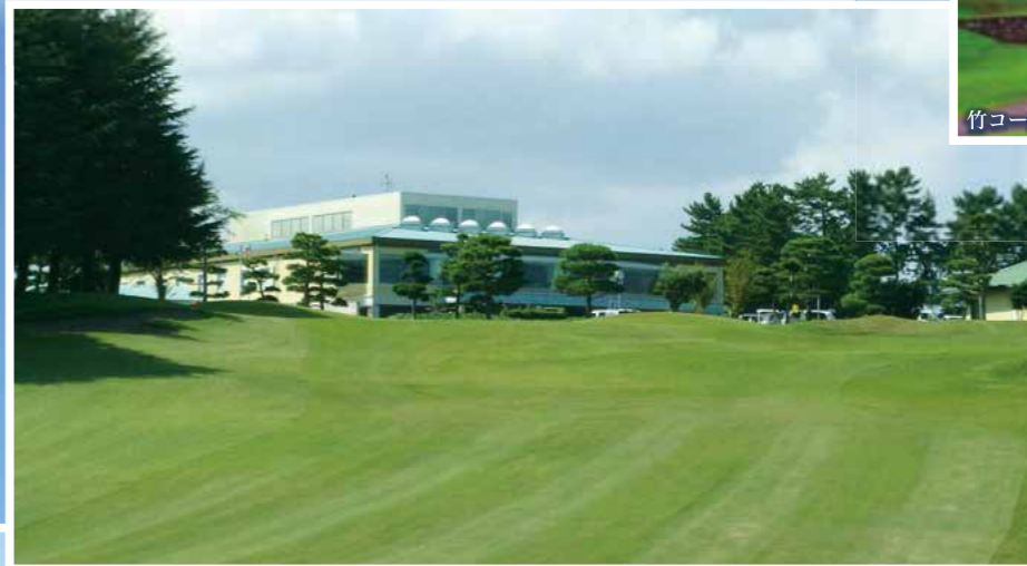
竹コース9番ホール

自然の条件を生かしたダイナミックな丘陵コース。樹木に囲まれた趣の異なるホールが5コース45ホール楽しめます。