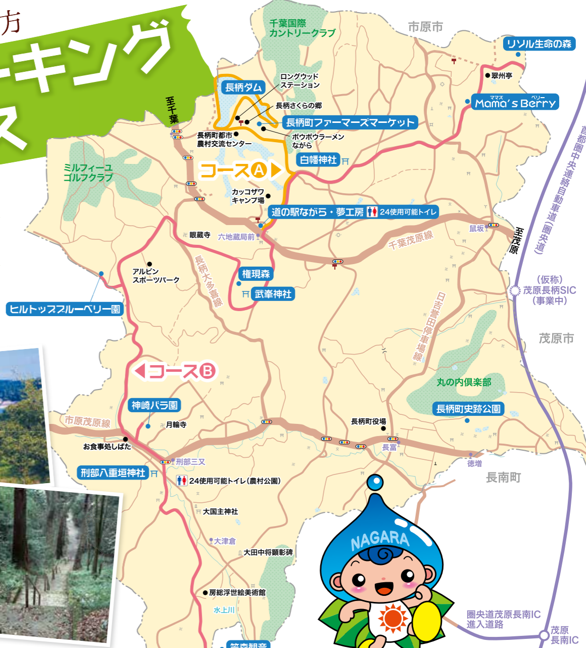
巨木がうっそうと茂る 権現森