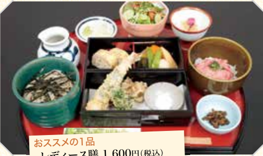
おすすめの1品 レディース膳 1,600円(税込)

おいしいそばのために、まず、そば畑からつくり、自家製粉、自家製麺した香り高い蕎麦をどうぞ