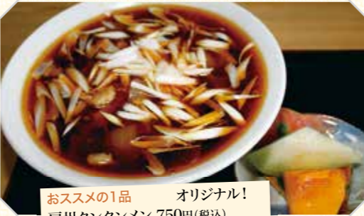
おすすめの1品 オリジナル! 房州タンタンメン 750円(税込)