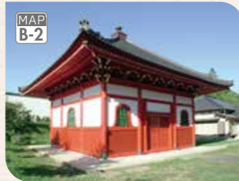
権現森の麓にある眼蔵寺