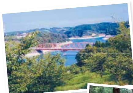
四季それぞれに美しい "きらめく水辺"長柄ダム

爽やかな風のなか、 長柄を ウォーキングして、 豊かな自然や 歴史を感じながら 健康になろう！