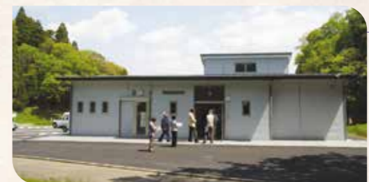
史跡長柄横穴群資料館

■特に13号横穴墓は、人、鳥、五重塔などの壁画(線刻画)を持つものとして有名です。