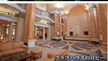
クラブハウスのロビー