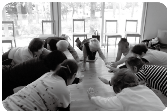
みんなで体操しています