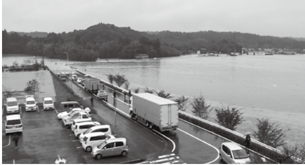
氾濫した一宮川 (役場屋上から撮影)

中規模から大規模農家への農地の集積を図ることが、これからの町農業の重要な施策になる。長柄町農業の維持発展のためには、法人にも重要な役割を担っていたことが重要である。しかしながら、法人は、その性格上、利益を生じさせなければならぬため、助成の効果が生じる前に、撤退してしまうことも、あり得る。まずは、ソフト面を充実させ側面から支援し、その中で、規模拡大のための助成を考えることとし、今後、必要な要件等を研究していきたい。