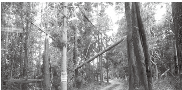
昨年の台風15号による倒木により損傷した電線 (山之郷地先)