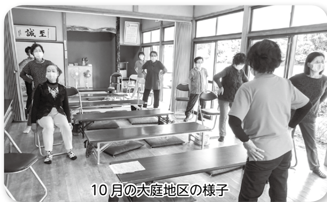
10月の大庭地区の様子

大庭地区の教室は、平成27年2月からスタートし、10月の教室で60回目となりました。1回の参加者が7～10名程度、推進員が4名で実施しています。推進員の皆さんがオリジナルで考案したプログラム (輪ゴム体操・脳トレ等) を行い、毎回賑やかです。笑顔で楽しく過ごしているので、お近くの方はぜひお越しください。