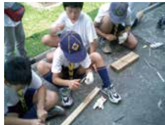
竹とんぼ造り 子供から大人まで楽しめます。