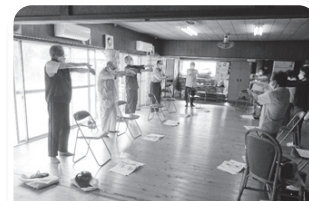
整理体操 手首・腕の前のストレッチ