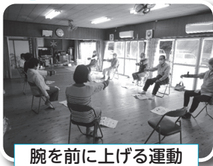
腕を前に上げる運動

毎週水曜日13時30分から、長柄山青年館でおもりの体操教室を開催しています。おもりの体操をする時に息を止めないよう、音楽に合わせて歌を歌いながら実施します。おもりの体操のほかに、脳トレで認知症予防や、ボールを使った転倒予防体操を楽しみながら行っています。