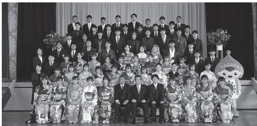
写真は令和4年成人式

令和4年4月から「民法の一部を改正する法律」の施行により成年年齢が20歳から18歳に引き下げとなりましたが、町では、従来どおり20歳を対象に（当該年度に20歳になる方）人生の門出を祝福し式典を開催します。