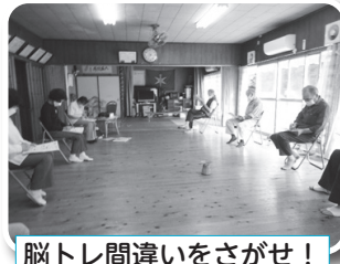
脳トレ間違いをさがせ!