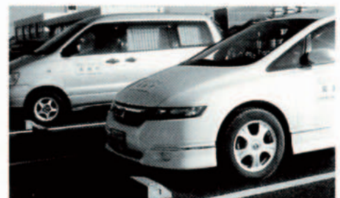
巡回パトロール活動