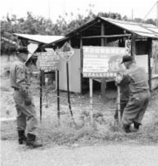
* 長柄町不法投棄監視パトロールで「不法投棄禁止看板」の補修及び清掃を実施しました。

茂原警察署 ☎221-0110 長柄駐在所 ☎351-3106 日吉駐在所 ☎351-3100