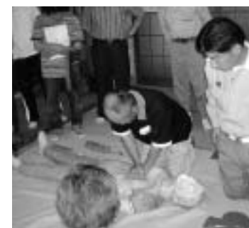
写真は長柄山自治会