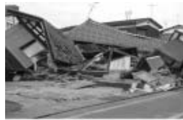
写真は平成16年10月に発生した新潟県中越地震により倒壊した家屋

「災害は忘れた頃にやってくる」といわれます。新聞・テレビ等で数年か数十年のうちには、首都圏を中心とした首都直下地震や東海地方を震源とした東海地震などの大地震が発生するという報道がされております。人は、いざ災害が発生すると周囲が見えにくくなり、何もすることができません。そのためには、各家庭内においても日頃から話し合いをするなど、町民の皆さんひとり一人が「災害」に備えるよう心掛けましょう。