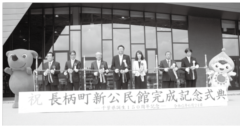
完成記念式典テープカットの様子

新公民館は昨年10月からプレオープンをしていますが、このたび駐車場を含む外構工事が無事完成し、6月24日に完成記念式典を開催しました。晴天のもと、オープニングセレモニーでテープカットが行われ、「チーバくん」と「ながラン」もお祝いに駆けつけてくれました。また、式典の最後には、ゴースト音楽院の方々によるコンサートがあり、美しい演奏で公民館の完成に華が添えられました。