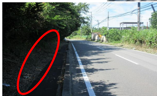
< 対策後 >