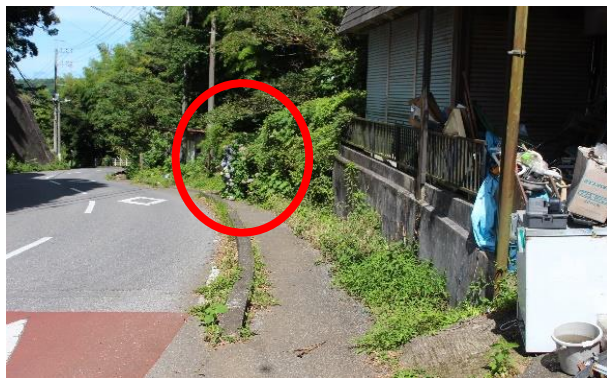
< 状況写真 >