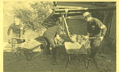
【令和元年度房総半島台風復興支援の様子】

令和元年度房総半島台風でも災害ボランティアセンターの設置や、被災地で復旧・復興活動を行うボランティア団体の支援のために県内25市町村で3,659万円が活用されました。