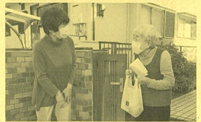
【高齢者見守り訪問】

令和4年度の千葉県の助成総額約5億7千万円のうち、約4億2千万円は市町村の身近な福祉のために助成し、約1億5千万円は県域の福祉のために助成しました。