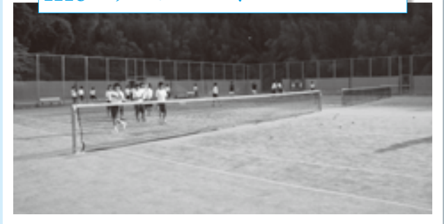
テニスコートの整備 コートを 2 面人工芝にて整備しました。透水性が高く、水はけがよいのが特徴です。