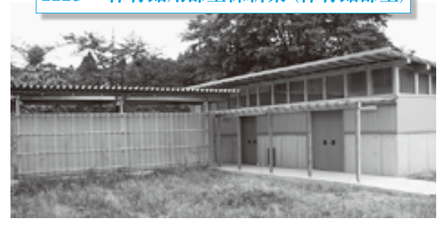
体育館用部室概要 2 部室部屋 体育倉庫