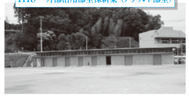
部室の整備 グラウンド入口と体育館裏に木造の新しい部室が完成しました。6 部屋 体育倉庫 便所