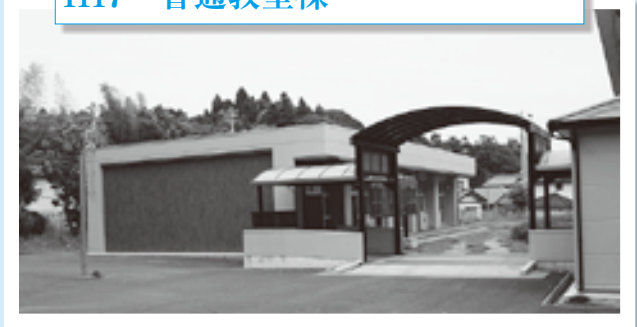
普通教室棟の整備 本校舎の北側に普通教室 2 部屋・便所を建築