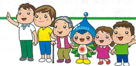
長柄町マスコットキャラクター ながラン