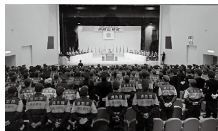
▲消防出初式の様子