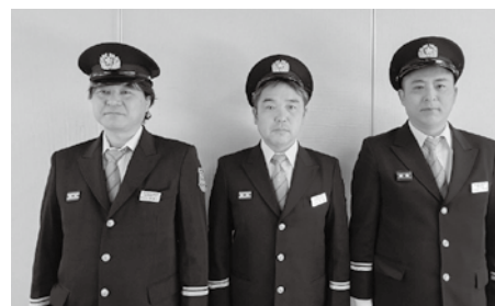
▲左から美濃川副分団長、大岩副分団長、宮澤副分団長