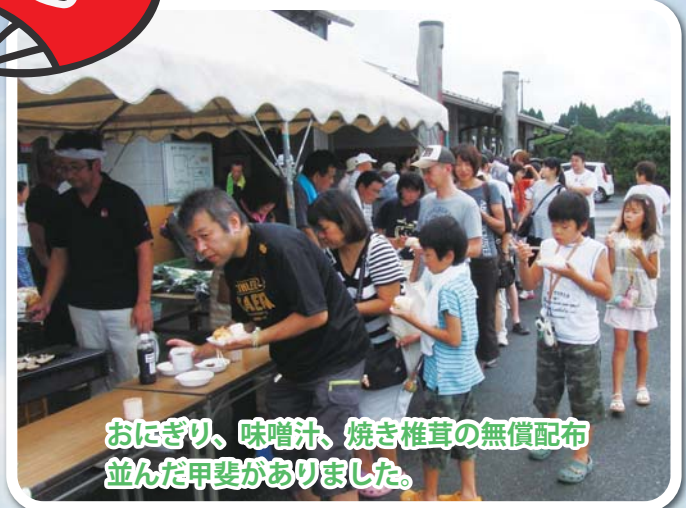
おにぎり、味噌汁、焼き椎茸の無償配布 並んだ甲斐がありました。

9月4日、道の駅「ながら」・9月11日、ファーマーズマーケットで新米まつりが開催されました。