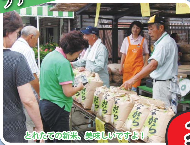
とれたての新米、美味しいですよ！