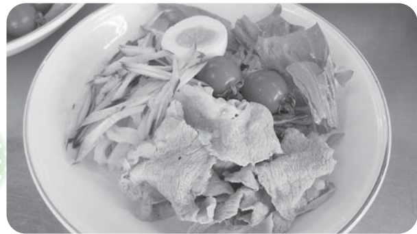
学童クラブ料理教室で作った「豚しゃぶサラダうどん」です♪