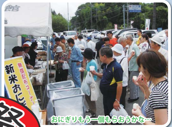
おにぎりもう一個もらおうかな…