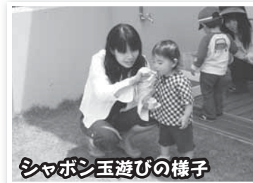
シャボン玉遊びの様子

◆◆支援センターは、妊婦さんや子育て中のみなさんの応援団、ぜひ遊びに来てください◆◆