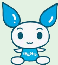
愛の妖精 「けんけつちゃん」