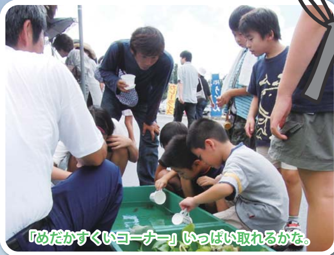
「めだかすくいヨーナー」いっぱい取れるかな。