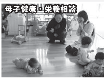
母子健康・栄養相談