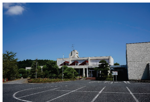
災害対策本部の代替拠点となる長柄町公民館は2021年から新設を予定（長柄町）