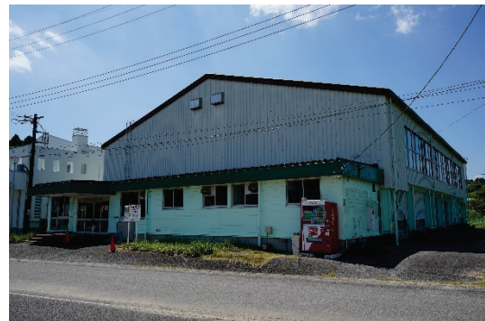
茂原長柄スマートインターへの連絡道路付近の道路拡幅による利便性向上（長柄町、左図） 長柄町体育館は受援拠点としての整備を検討予定（長柄町、右図）