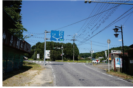
県道 147 号線（長柄山集落付近、左図）と県道 13 号線（針ヶ谷交差点付近、右図）は狭あいで大型車両のすれ違いが困難なため県に対して早期の改善要望（長柄町）